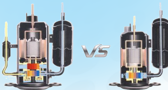
Gree kahestmeline inverter kompressor